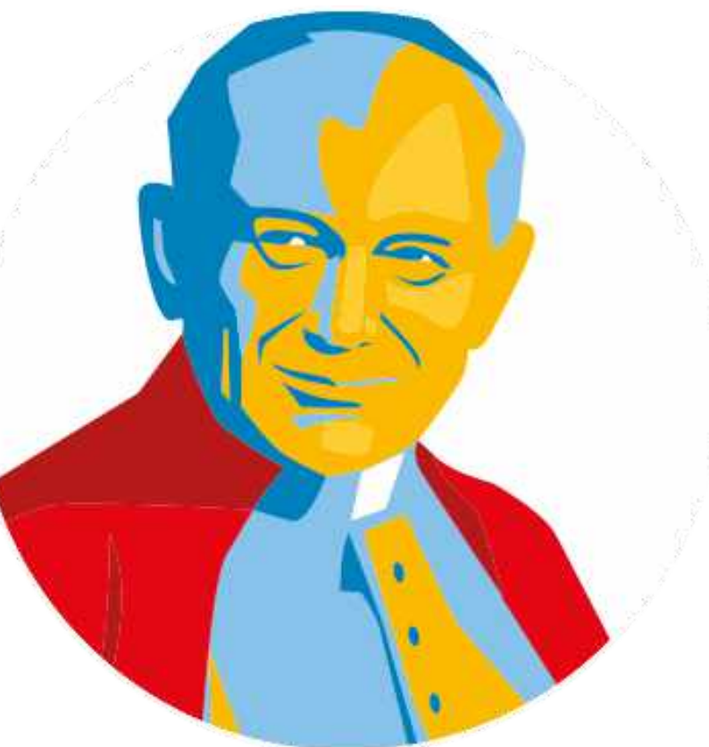
Saint Jean-Paul II