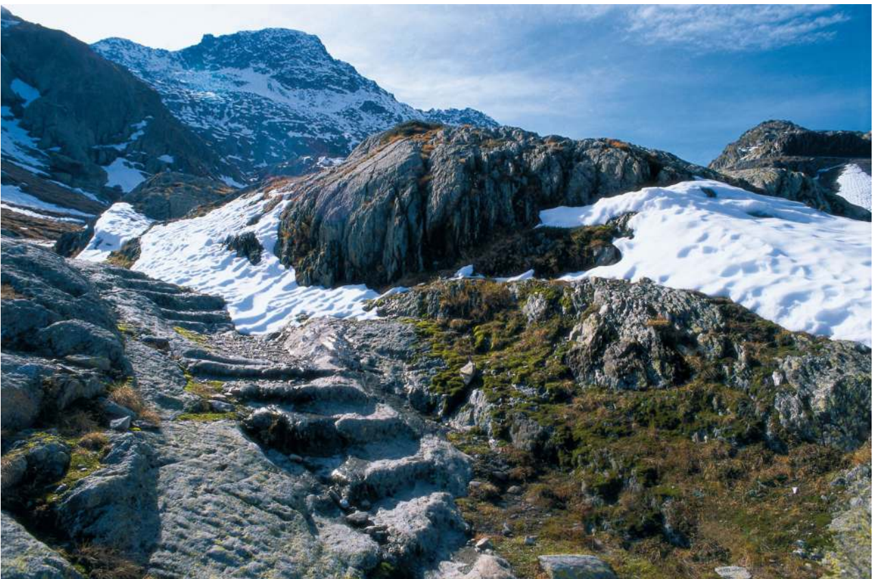
Via Francigena: au-dessus du Plan de Barasson.

Le réseau d'itinéraires culturels en Suisse a défini le parcours de la Via Francigena selon le parcours entrepris par Sigéric, archevêque de Canterbury, en 990. En Suisse les étapes officielles sont Yverdon-les-Bains, Orbe, Lausanne, Vevey, Aigle, Saint-Maurice, Orsières et Bourg-Saint-Pierre. Afin de rendre le parcours plus agréable à la découverte du pays, d'autres lieux d'étapes sont venus agrémenter le parcours du voyageur.